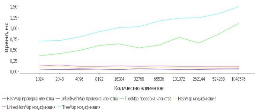
Рис. 3. Сравнение HashMap, LinkedHashMap и TreeMap

Множество Set реализовано в Java Collection Framework как словарь Map, у которого ключ – элемент множества данных, а значение – объект класса Object. В пакете java.util имеются три класса реализации интерфейса Map: HashMap, LinkedHashMap и TreeMap. На рис. 3 приведены оценки производительности этих коллекций.